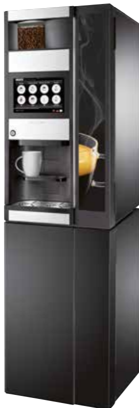
Det elegante underskab understøtter automatens design.